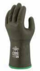
オリーブグリーン