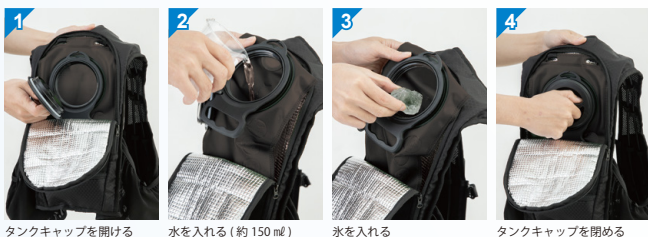
タンクキャップを開ける