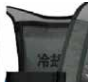
体にフィットするパワーメッシュ仕様