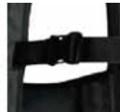
簡単に着脱できるバックル