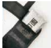
サイド(脇部2箇所)にアイスパックを収納