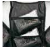
背面2箇所にアイスバックを収納